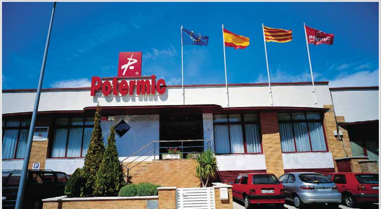
Sede central POTERMIC La Palma de Cervelló (Barcelona)