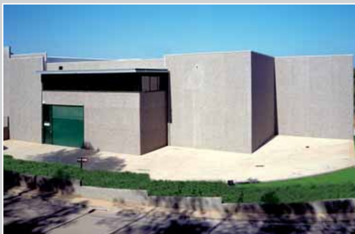
Almacén FRA.BO Ibérica - RACOREX Cervelló (Barcelona)

Nuestros productos se encuentran disponibles en tiempo real, seleccionados y controlados para una rápida entrega y con promociones permanentes PCP (producto-cantidad-precio).