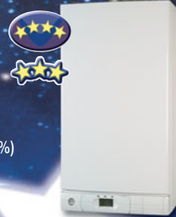
Mira Green System

A condensación, solo calefacción Máximo rendimiento (108%) Máxima ecología - clase NOx 5 Disponibles en 24kw FF - 30kw FF - 35kw FF Dimensiones: 720X390X295 (mod. 24kw)